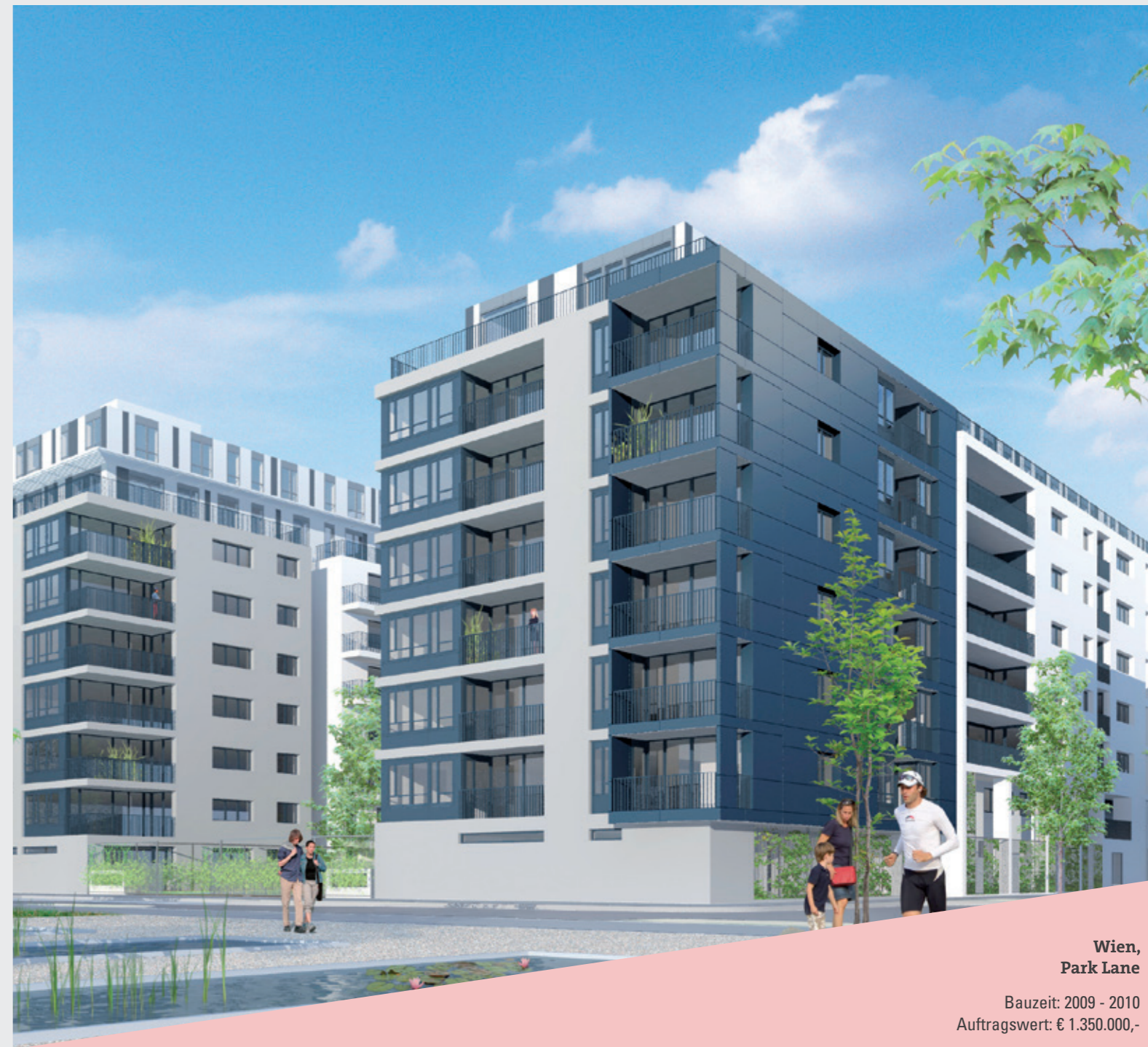
Wien, Park Lane

Bauzeit: 2009 - 2010 Auftragswert: € 1.350.000,-