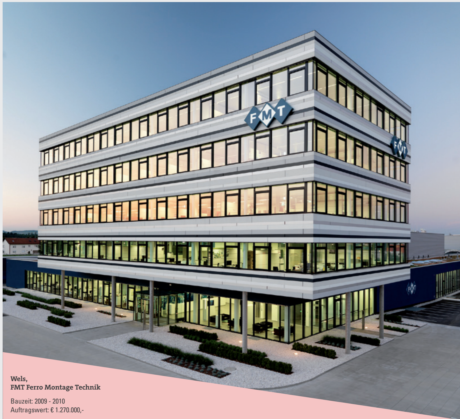
Wels, FMT Ferro Montage Technik

Bauzeit: 2009 - 2010 Auftragswert: € 1.270.000,-