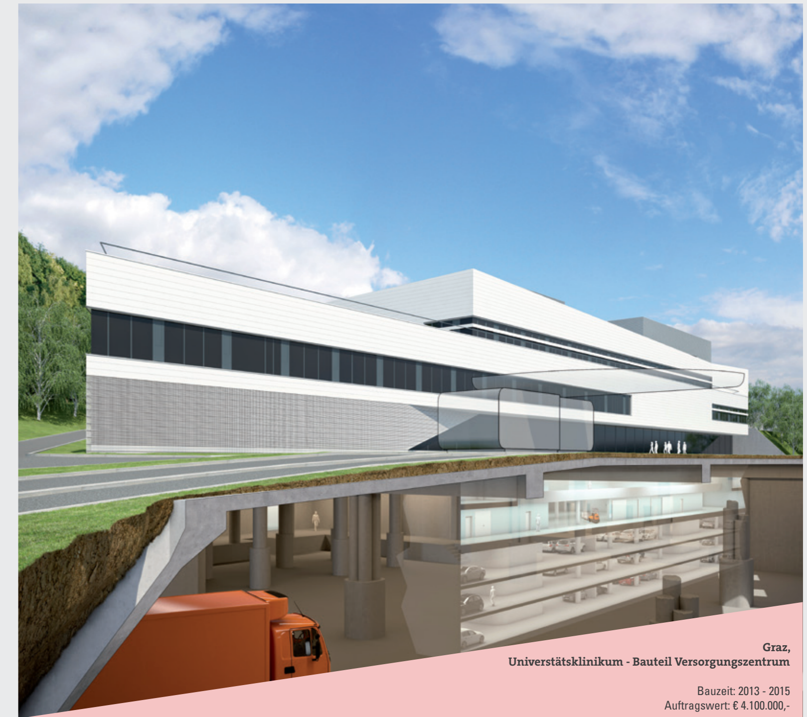
Graz, Universitätsklinikum - Bauteil Versorgungszentrum

Bauzeit: 2013 - 2015 Auftragswert: € 4.100.000,-