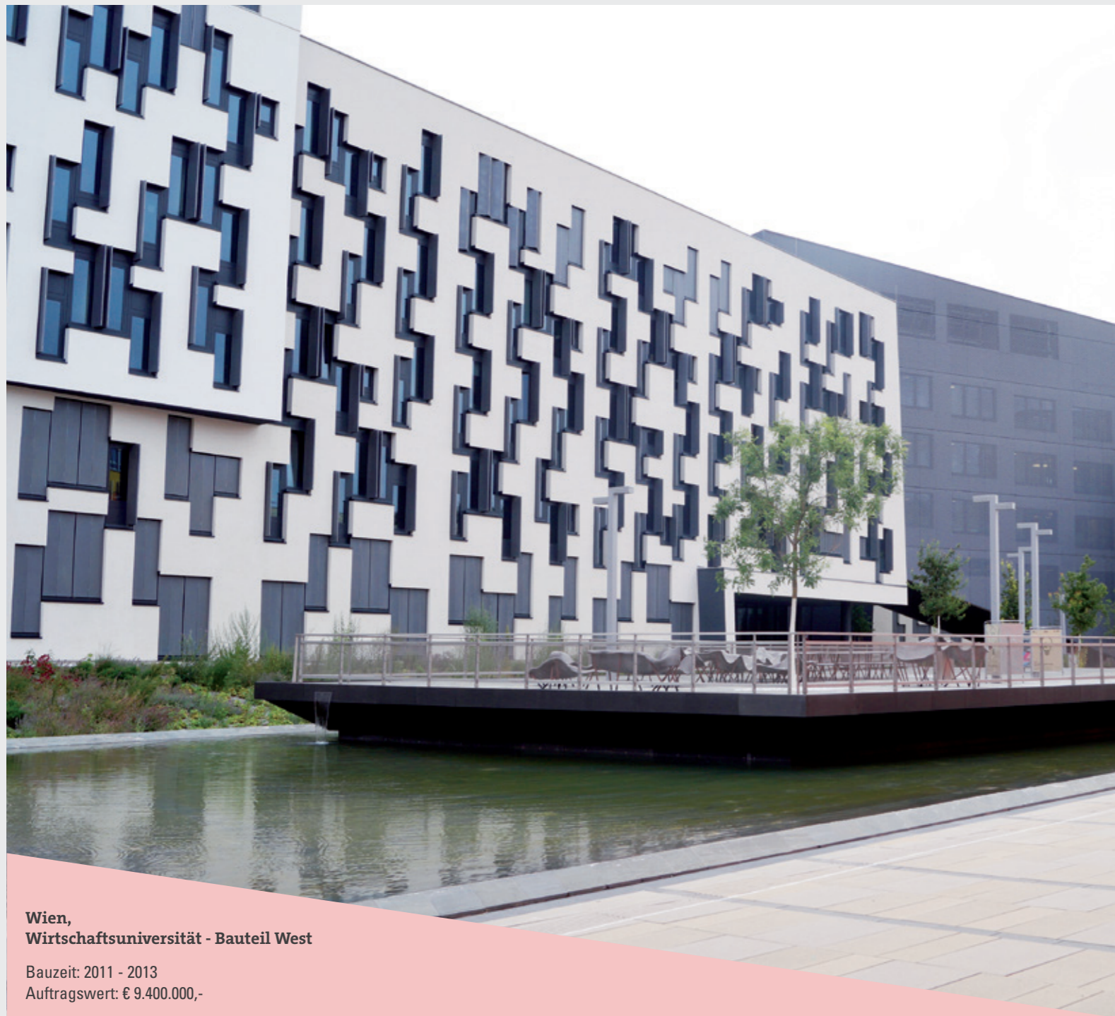
Wien, Wirtschaftsuniversität - Bauteil West

Bauzeit: 2011 - 2013 Auftragswert: € 9.400.000,-