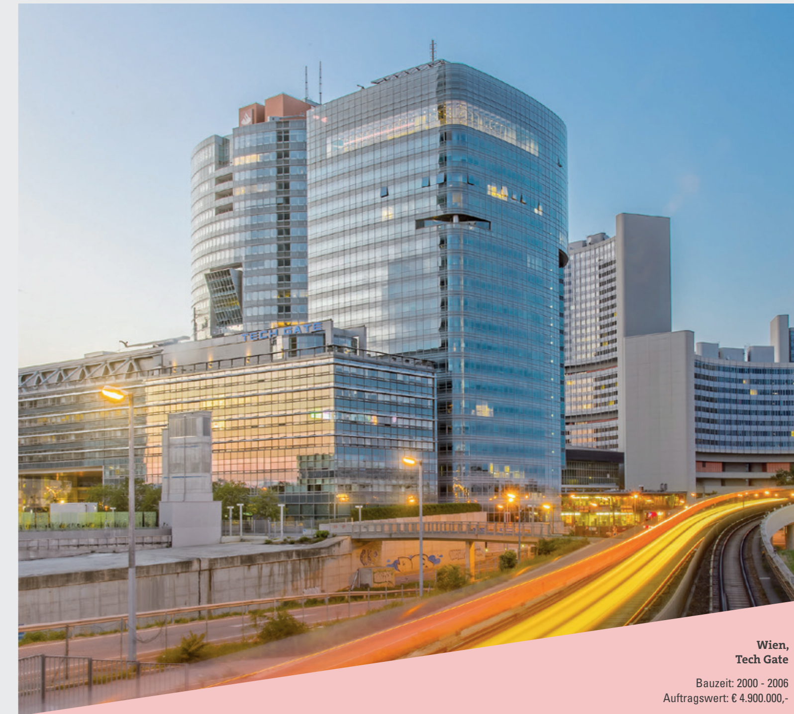
Wien, Tech Gate

Bauzeit: 2000 - 2006 Auftragswert: € 4.900.000,-